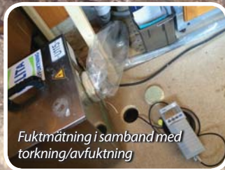
Fuktmätning i samband med torkning/avfuktning