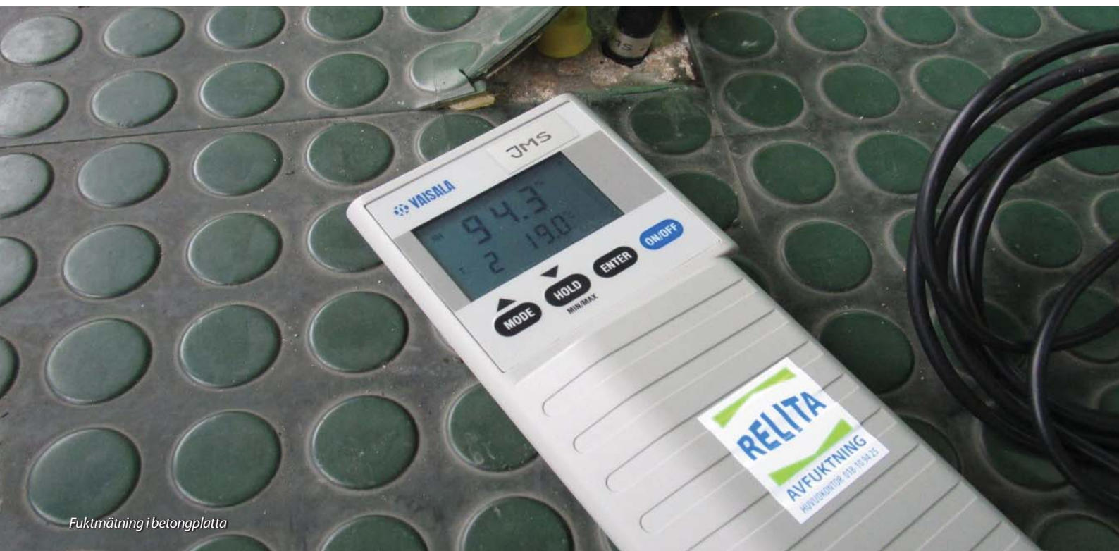
Fuktmätning i betongplatta