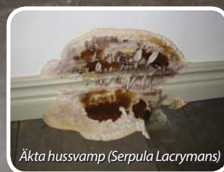
Äkta hussvamp ( Serpula Lacrymans )