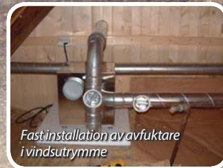
Fast installation av avfuktare i vindsutrymme