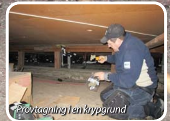
Provtagning i en krypgrund