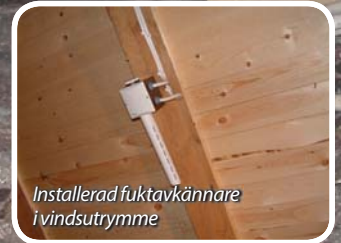
Installerad fuktavkännare i vindsutrymme