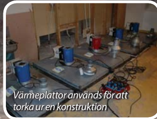
Värmeplattor används för att torka ur en konstruktion